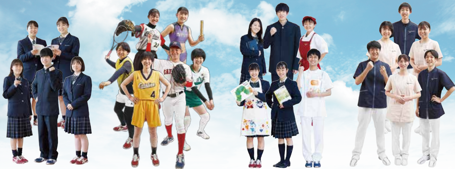
普通科：特進グローバル・シティズンシップコース